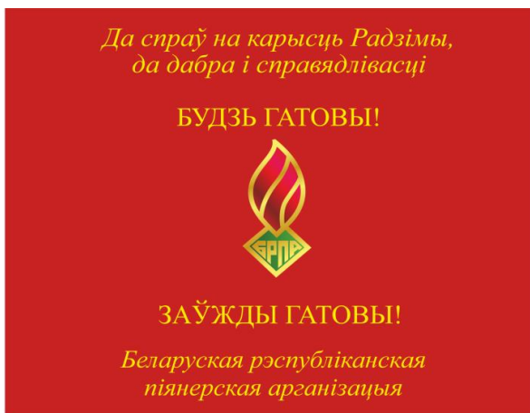
Знамя областной (Минской городской) пионерской организации (лицевая сторона)