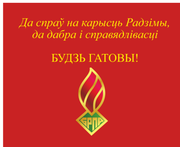
Знамя ОО «БРПО» (оборотная сторона)