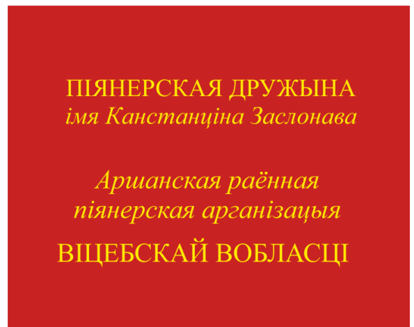
Знамя пионерской дружины (оборотная сторона)