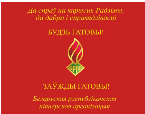
Знамя пионерской дружины (лицевая сторона)