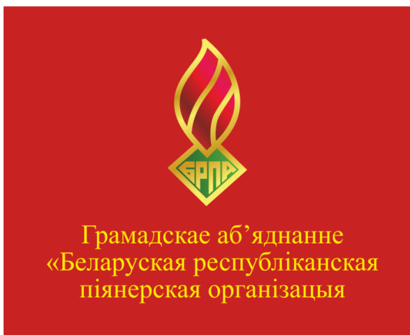
Знамя ОО «БРПО» (лицевая сторона)