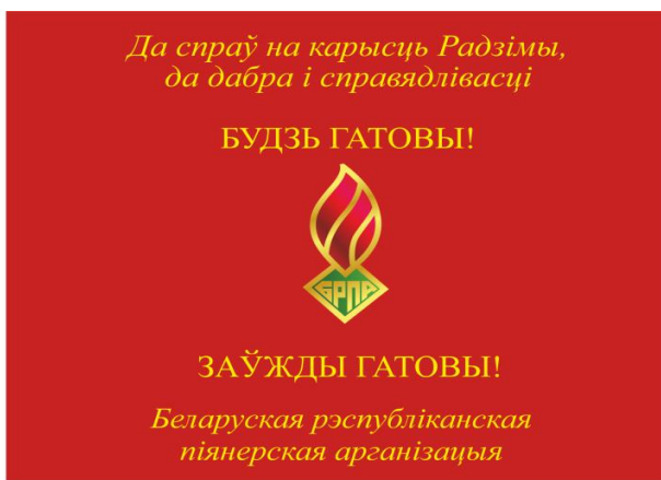
Знамя районной (городской) пионерской организации (лицевая сторона)