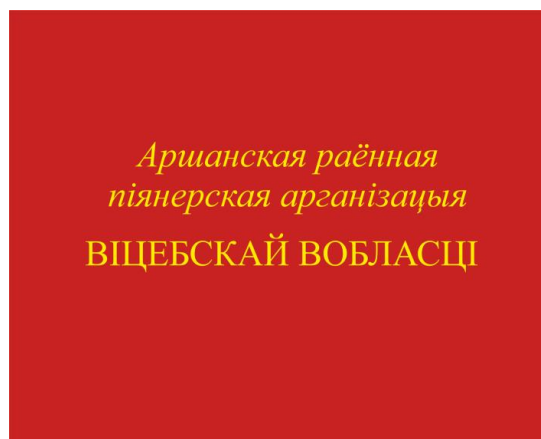
Знамя районной (городской) пионерской организации (оборотная сторона)